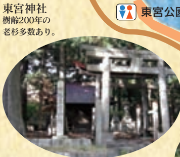
東宮神社 樹齢200年の老杉多数あり。