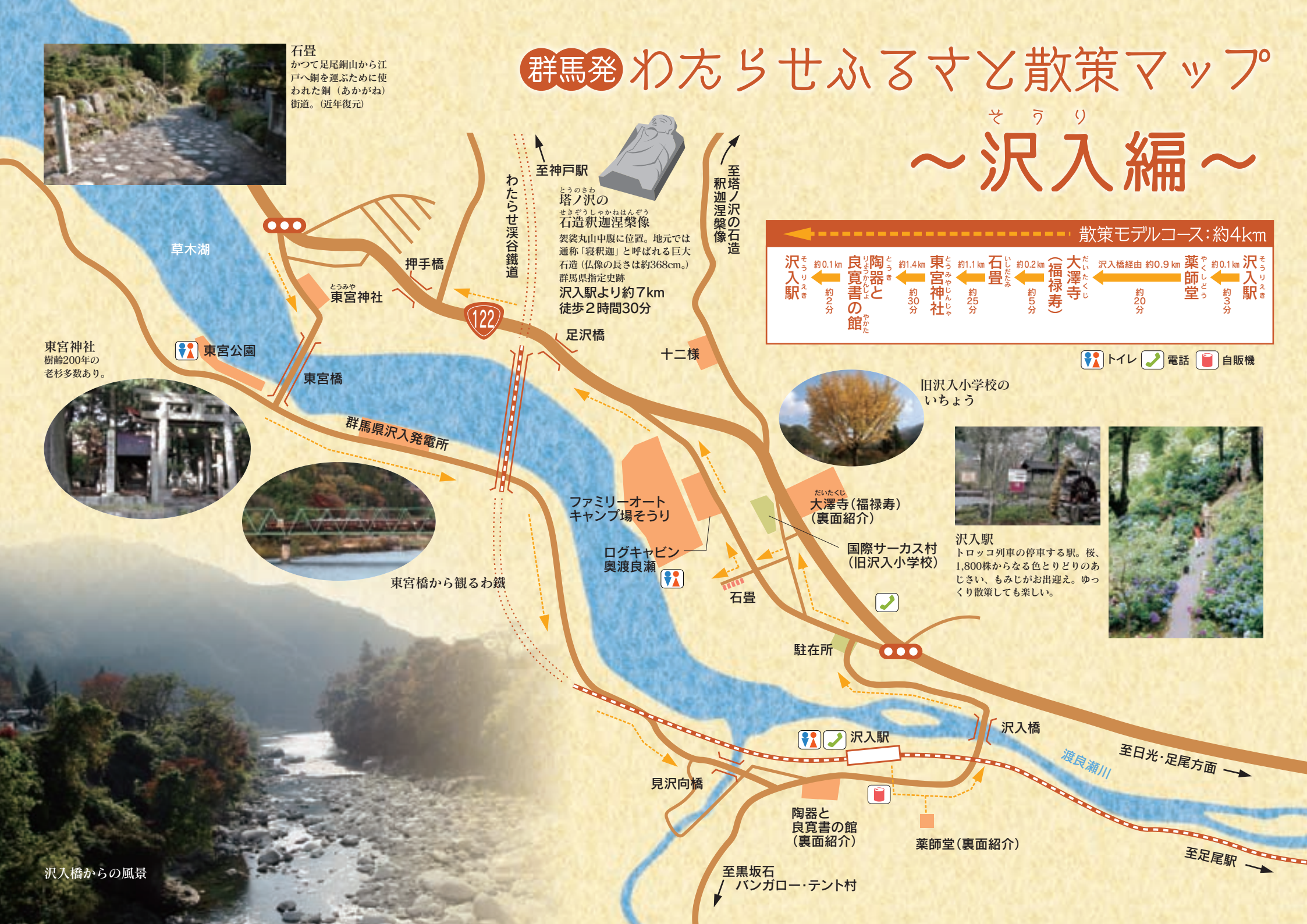
沢入橋からの風景