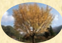
旧沢入小学校の いちよう