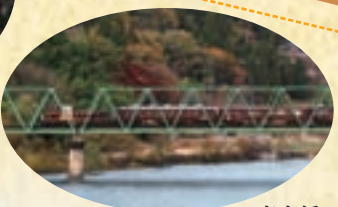
東宮橋から観るわ鉄