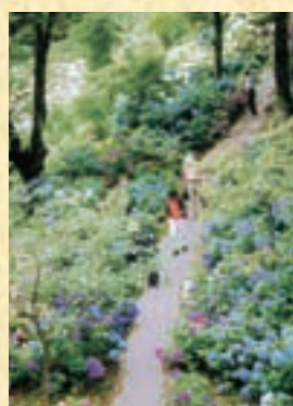
沢入駅 トロッコ列車の停車する駅。桜、1,800株からなる色とりどりのあじさい、もみじがお出迎え。ゆつくり散策しても楽しい。