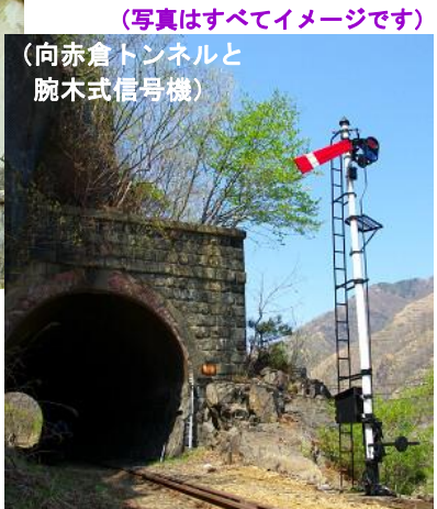
(向赤倉トンネルと腕木式信号機)

現在の終着駅・間藤からかつての終着駅・足尾本山までの廃線跡をたどるツアーです。トンネルあり鉄橋ありの変化に富んだ区間で、今回は特別に、お客様からご要望が多かった「 旧足尾本山駅構内 」と「 本山製錬所 」の見学つきです。さらに足尾町内では明治時代の迎賓館「 古河掛水倶楽部 」を見学。往復はトロッコわっしー号に乗車します。