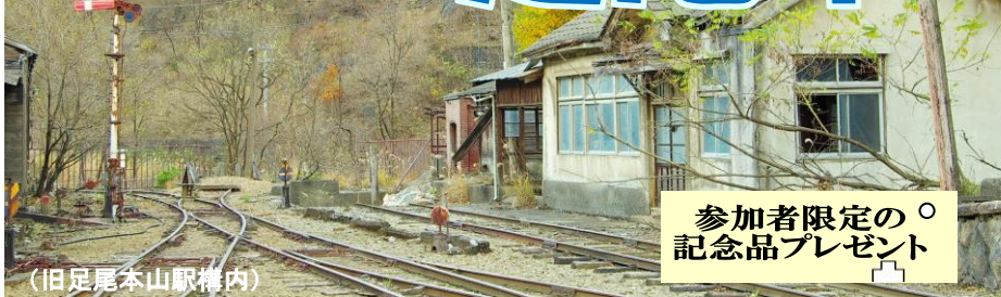
(旧足尾本山駅構内)