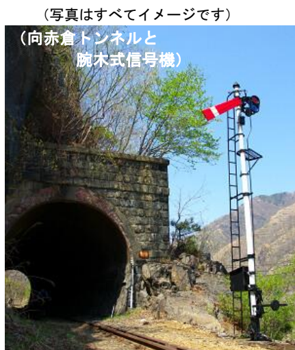
(写真はすべてイメージです) (向赤倉トンネルと腕木式信号機)