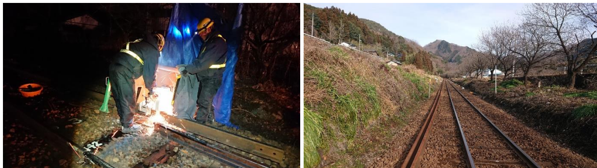
<神戸～沢入間レールの重軌条化工事>