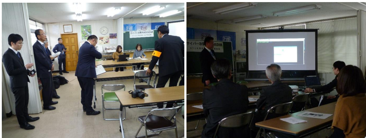
<JR東日本高崎支社総合復旧訓練>