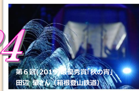
第6回(2019)最優秀賞「秋の宵」 田辺 肇さん(箱根登山鉄道)