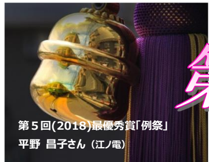
第5回(2018)最優秀賞「例祭」 平野 昌子さん(江ノ電)