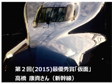
第2回(2015)最優秀賞「仮面」 高橋 康資さん(新幹線)